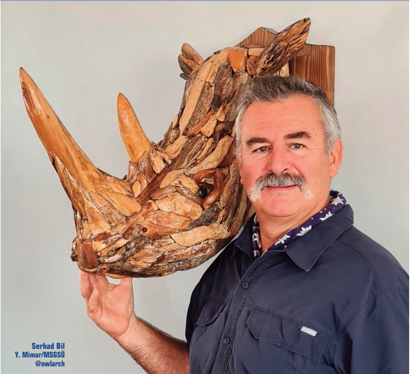
Serhad Bil Y. Mimar/MSGÜ @owlarch