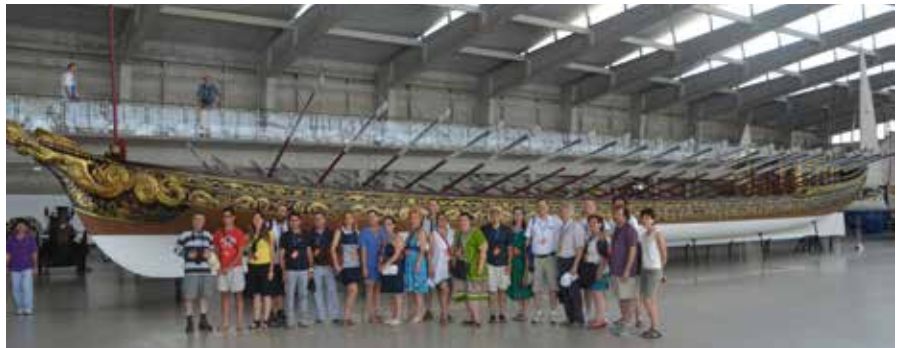
Lizbon'da Türk Rotaryenler, eski bir kayığın önünde

Her konvansiyonun sonunda olduđu gibi, bu konvansiyon da kapanırken, bir yıl sonra yapılacak olan konvansiyonun ön tanıtımı yapıldı. 2014 yıl UR konvansiyonu Avustralya'nın ünlü şehri Sydney'de gerçekleştirilecek. Ünlü Opera binası, yeřillikler içinde bir yaşam ve vahři bir tabiatın birarada olduđu bu güzel şehirde Rotary Konvansiyonuna katılır. Şimdiden bu güzel fırsatı kaçırmamak için hazırlıklarınızı yapmanızı öneriyoruz.