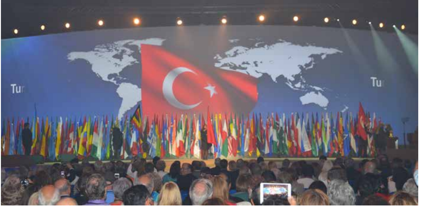
Lizbon Konvansiyonunun açılış oturumunda bayrak töreninde Türkiye anons edilirken

U luslararası Rotary'nin 2012-13 döneminin zirvesi olan Konvansiyon, Portekiz'in başkenti Lizbon'da 23-26 Haziran tarihleri arasında neşeli bir bayram atmosferi içinde gerçekleştirildi. Portekiz'in şirin başkentinde hazırlıklar tamamlanmış ve dünyanın dört bir tarafından gelecek olan Rotaryenleri beklemektey-