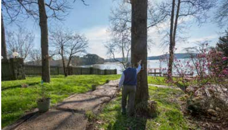
Tennessee'nin Chattanooga şehrinin Riverside semtindeki evinin arka bahçesi