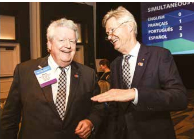
San Diego'daki Uluslararası Asamblede Başkan Maloney ve Gelecek dönem başkanı Holger Knaack