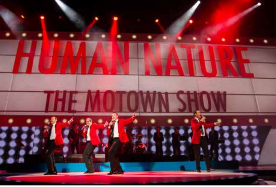
Human Nature adlı grup, açılış oturumunda "Motown Show" adlı gösterileriyle katılımcıları eğlendirdi. (üstte) UR direktörleri birarada (altta)