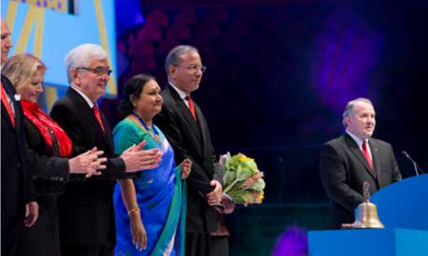
2013-14 dönemi Uluslararası Rotary Başkanı Ron Burton konvansiyonun 2. gününde konuşmasını Rotary liderleriyle beraber yaptı. Resimde Burton'ın yanında 2015-16 Başkan adayı Ravindran ve eşi, direktör Şafak Alpay ve eşi Deniz görülüyor

programlara yaptığımız yatırımın karşılığını alma konusunda sınıfta kaldık. Yeni nesilleri de aile gibi değerlendirmeli ve onları kaybetmeden Rotary'nin önemli bir parçası olduklarını onlara yansıtmalıyız."