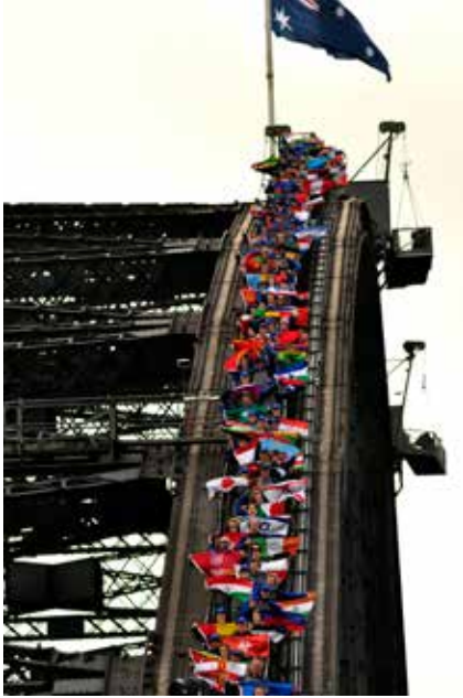
Rotaryenler Sydney Köprüsüne aynı anda tırmanan en fazla insan ve en çok değişik bayrak taşıyan grup olarak yeni bir rekora imza attılar

Avustralya Başbakanı Tony Abbott ve New South Wales Eyalet Başbakanı Mike Baird, Konvansiyon katılımcılarına hitap ettiler ve Avustralyalı Rotaryenlere katkı için güvence verdiler. Başbakan Abbott son günlerde federal bütçedeki değişiklikleri nedeniyle eleştirilmekteydi. Ancak konvansiyona ayakta alkışlanarak giriş yaptı. "Her zaman böyle bir tezahürat ile karşılaşmıyorum" diye Abbott, "umarım aranızda çok sayıda Avustralyalı vardır" diyerek espri anlayışını katılımcılara gösterdi ve "Avustralya hükümetini yaptıkları için alkışlamayın, yaptıklarınız için kendinizi alkışlayın" dedi.