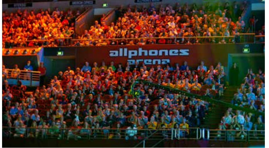
Sydney'deki konvansiyonun 1 Hazirandaki açılış oturumu