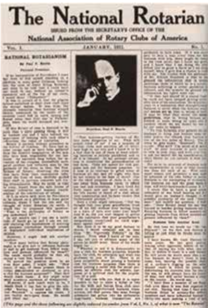
Ocak 1911'de yayınlanan ilk Rotary dergisi The National Rotarian