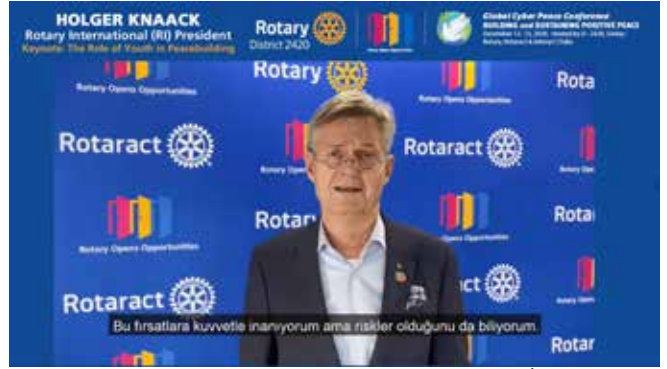
UR Başkanı Holger Knaack Konferansta "Barışın İnşasında Gençliğin Rolü" başlıklı bir konuşma yaptı.

Ekim ayında Konferans konuları önceliklendirildi, açılış konuşmacıları belirlendi, paneller ve moderatörler, atölyeler ve