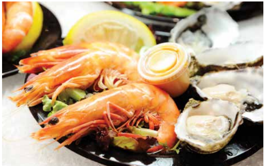
Deniz mahsulleri Sydney'in özelliklerinden. Karides, ıstiridye ve Barramundi olarak adlandırılan balığı tatmanız tavsiye edilir.

rideslerin ebatları sizi şaşırtabilir. Barbun, ıstakoz ve yörenin ünlü barramundisini tatmadan Sydney'de yemek yedim diyemezsiniz. İstiridye-leri ise biraz değişik. Tadına alışık değilseniz, ısmarlamadan önce bir tanesinin tadına bakmanızı tavsiye ederiz.