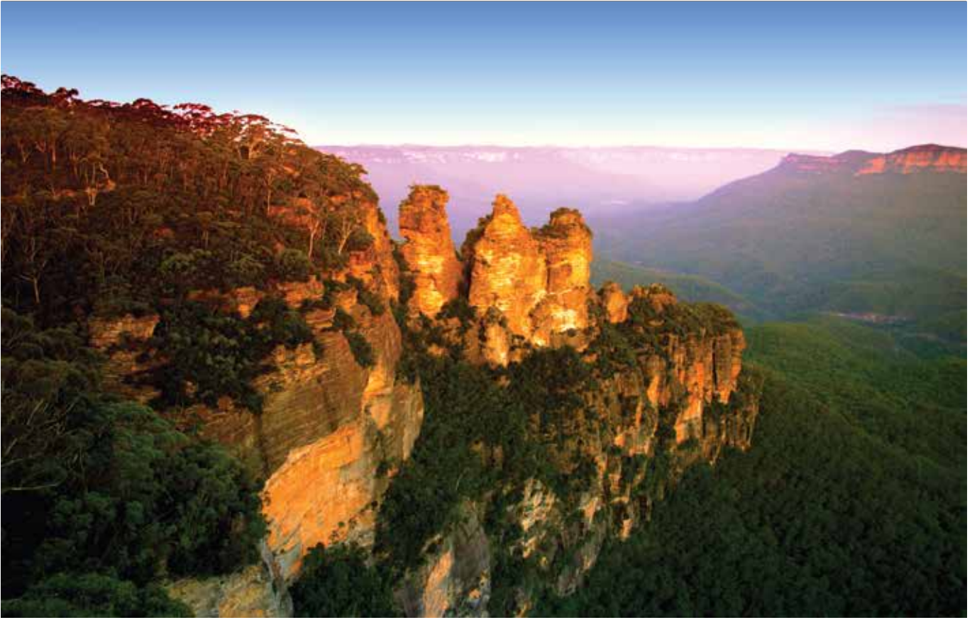
Sydney'in 100 kilometre batısında Mavi Dağlar olarak adlandırılan kaya ve bitki formasyonu bulunuyor. Resimde,Üç kızkardeş olarak anılan kayalar görülüyor.

ve körfezi 360 derece görebilecek bir pozisyonda. Yürüyüş sırasında kameranızı yanınıza almanız yasak. Elbisenizin üzerine özel bir giysi giyip, nefes testi almak, metal detektörden geçip sorumluluğu kabul ettiğinize dair bir form imzalamanız gerekiyor. Köprüyü geçmek istemiyorsanız, alternatif olarak iki kulesinin tepesine çıkabilir ve nefis bir manzarayı kameranızla resmedebilirsiniz.