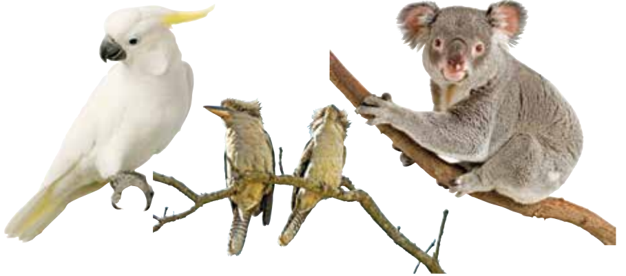
Avustralya’da koala ayısı gibi töreye özel hayvanlar görmek mümkün. Yukarıda soldan sağa Kakatu, Kukabura ve Koala görülüyor.