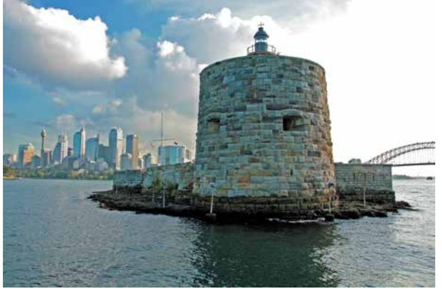
Sydney körfezinin girişinde bulunan kale, Kırım savaşı döneminde Rusların olası hücumlarından korunmak üzere inşa edilmiş ve 1857 yılında tamamlanmış.

2014 yılında yapılacak olan konvansiyona katılacak Rotaryenlere, Avustralyalıların ne kadar sevimli ve misafirperver olduklarını hatırlatmak isteriz. Bu nedenle, bir kere ziyaret ettiğiniz zaman, ayrılırken “Geri geldiğimizde” diye başlayan cümleler kurmaya başlarsanız şaşırmanın.