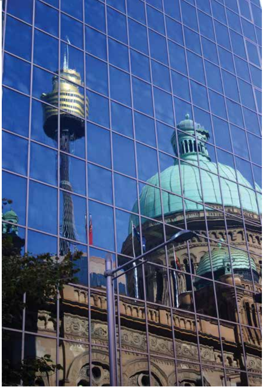
Sydney'in eski binaları muhafaza edilmiş ve ziyarete açık. Modern bir binanın camında yansımaları görünen televizyon kulesinin tepesinde güzel bir restoran bulunuyor.