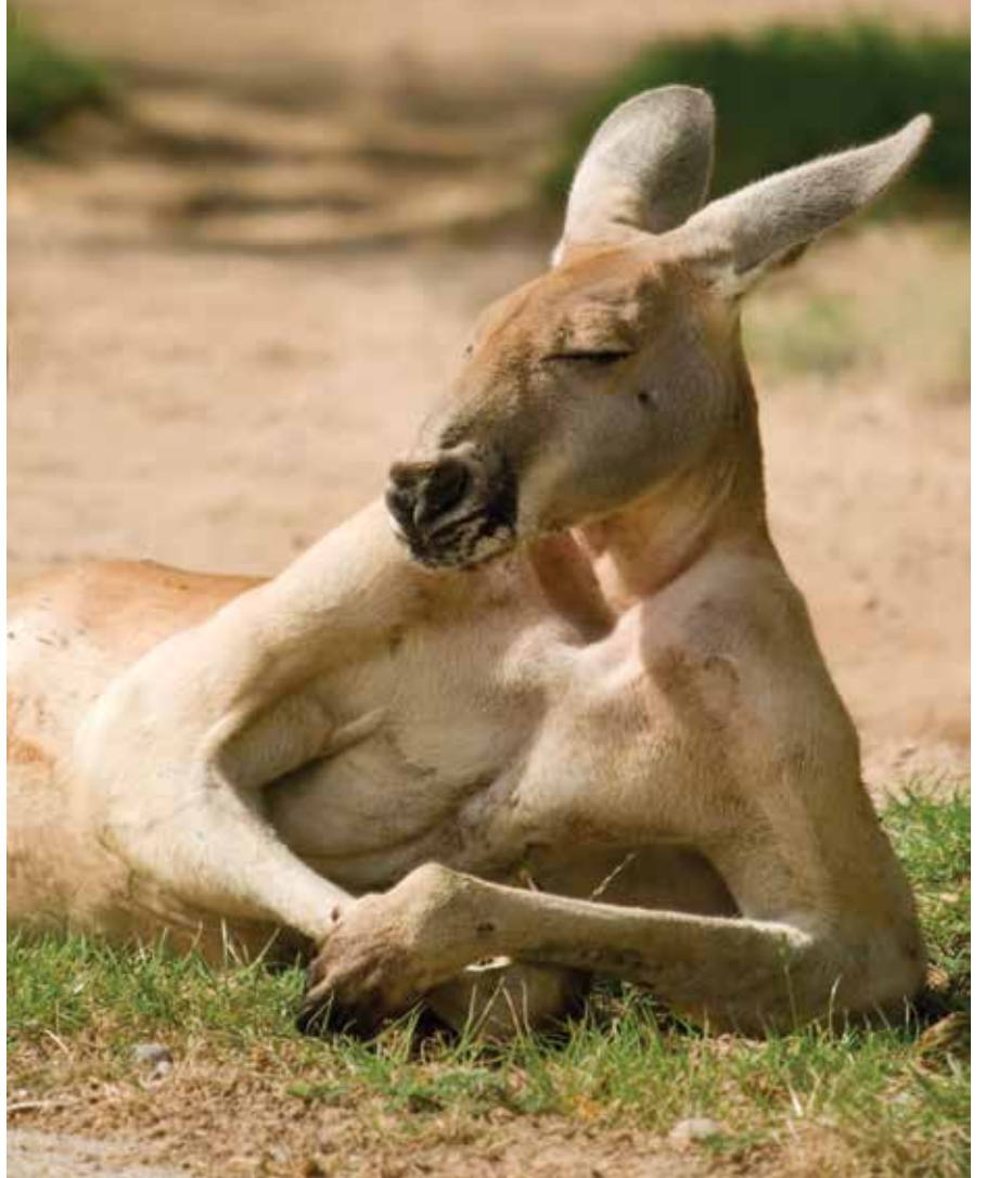
Tarango Hayvanat Bahçesi 4,000 çeşit ile görülmeye değer bir mekan. Yukarıda dinlenirken poz vermiş olan kangurulara ise sadece Avustralya'da rastlayabilirsiniz.