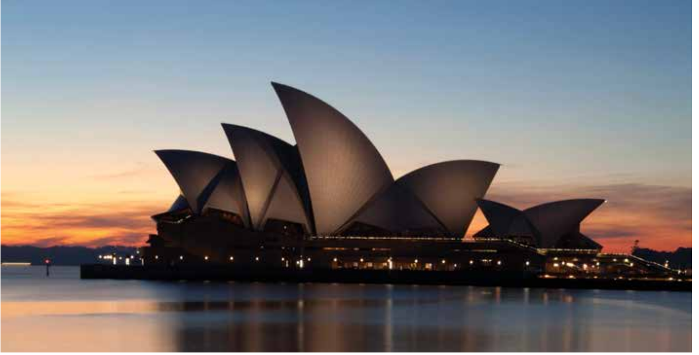
Danimarkalı Mimar Jørn Utzon'un projesini yaptığı bina, tüm zamanların en ilginç yapılarından biri

si olan Rocks'ta geçirdik. Daha sonra Captain Cook kurumunun düzenlediği ve öğle yemeğini de içeren körfez gezimizi yaptık. Opera binası, Harbour Bridge, Denison Kalesi ve diğer adalar, eyalet valisinin malikanesi ve Başbakanın rezidansı, körfezin etra-