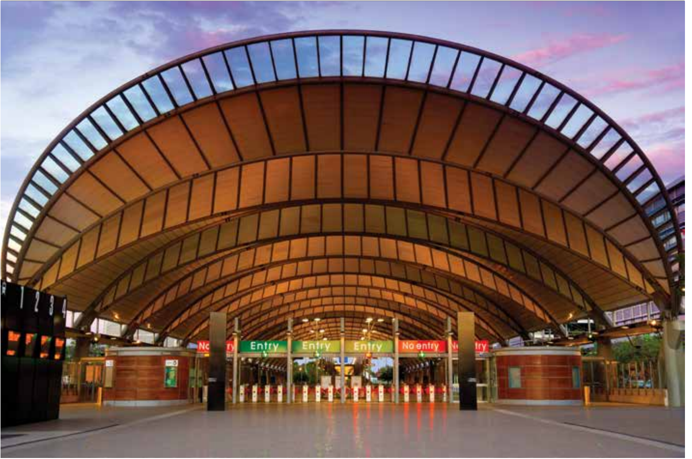
UR 2014 Konvansiyonu Avustralya'nın Sydney şehrinde yapılacak. Resimde Konvansiyonun yapılacağı Olimpik Park girişi görülüyor