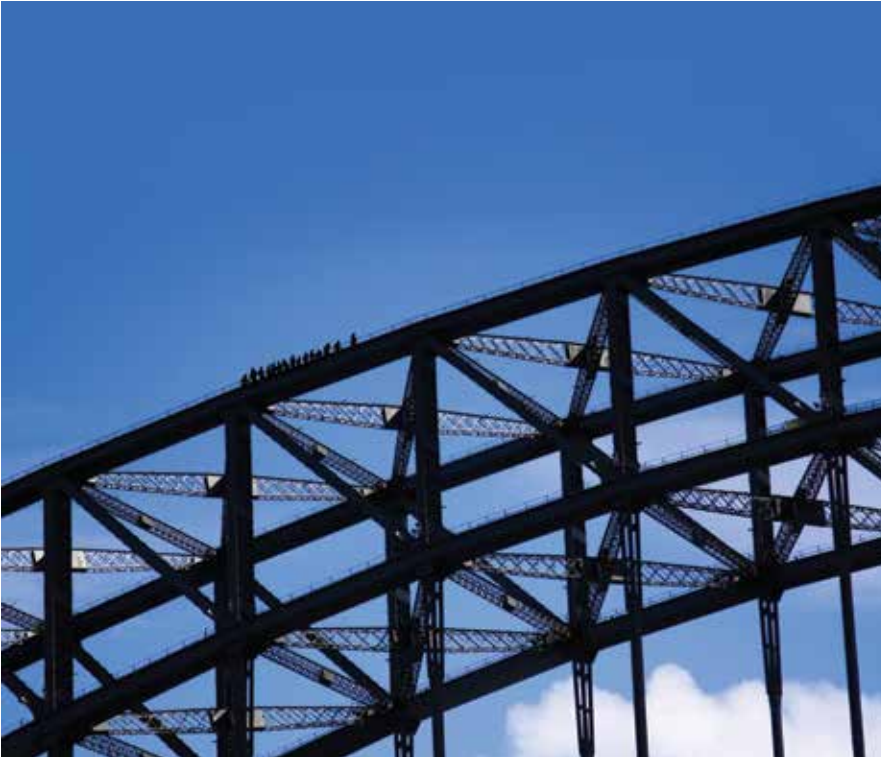
Sydney Körfez Köprüsü üzerine çıkarak 134 metre yüksekten şehri görebilirsiniz. Dünyanın sayılı adrenalin yaratıcı olaylarından olan bu yürüyüşe katılmak için nefesinizin yeterli olup olmadığını test ettirmeniz gerekiyor.

Avustralya'nın Aborijinleri hakkında bilgi edinmek için, Rocks bölgesinde 90 dakika süren Aboriginal Heritage Tour çok ilginçti. Bir aborijin Sydney'in en eski binası olan Cadman's Cottage önünde bizi karşıladı ve ilginç nebatlar hakkında bilgi verdi. Bir bitkinin uzun yaprağını kopardı ucunu biraz sürttü ve ilginç bir resim fırçası elde etti. Bir başka bitkinin yaprağını alıp iki avucu arasında sürttü ve bunun mide rahatsızlıkları-