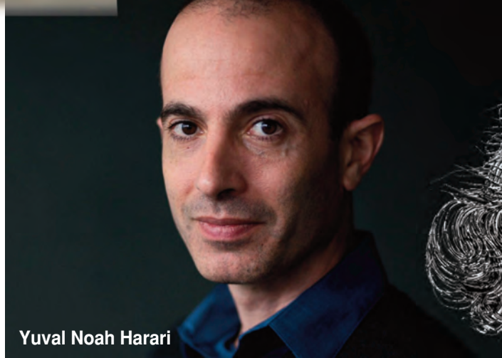
Yuval Noah Harari